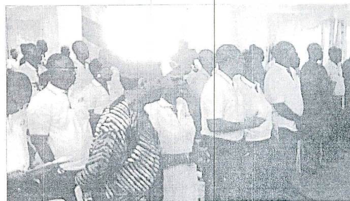
...devant une assistance faite de personnalités...