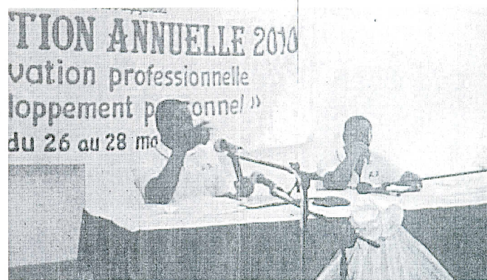
...renforcé par la suite par les membres du comité d'organisation