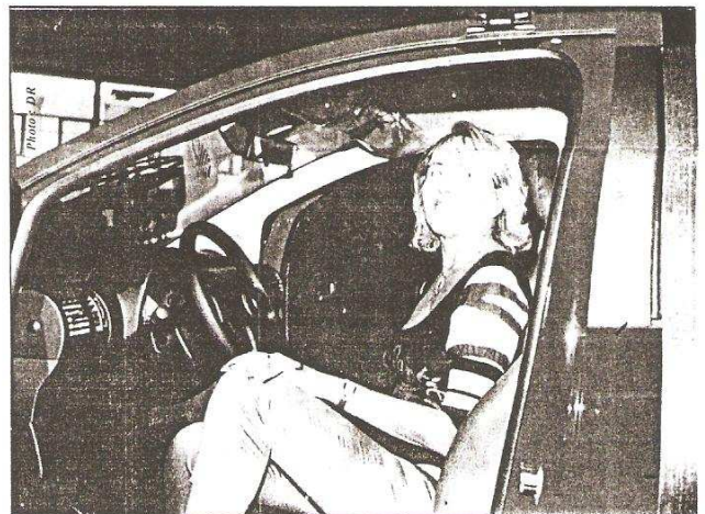
L'épouse de l'heureux gagnant dans la superbe voiture gagnée

rance privée agréée en lard (Incendie, Accident, Risque Divers) en République du Bénin à la suite de la libération du secteur des assurances au Bénin. Première compagnie d'assurance lard à ouvrir ses portes en mars 1998 après la levée du monopole d'Etat, l'Africaine est au plan national le n°1 de la branche lard. Elle a assis sa notoriété sur le respect des engagements pris vis-à-vis des assurés par un règlement rapide et équitable des sinistres enregistrés. Le professionnalisme des collaborateurs de l'Africaine des assurances garantit à l'assuré un traitement compétent et rapide de son dossier. Les tarifs de ses prestations sont régulièrement étudiés pour rester les plus compétitifs du marché et pour s'adapter aux performances individuelles de ses assurés. Autant d'atouts qui ont permis à l'Africaine des assurances de choisir son slogan : «Toujours plus proche de vous».