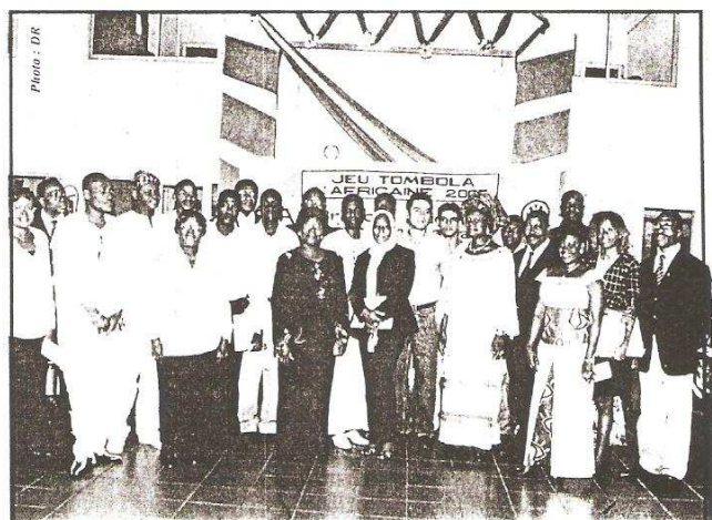
Vue d'ensemble des 16 bénéficiaires et organisateurs du jeu tombola «l'Africaine 2006»