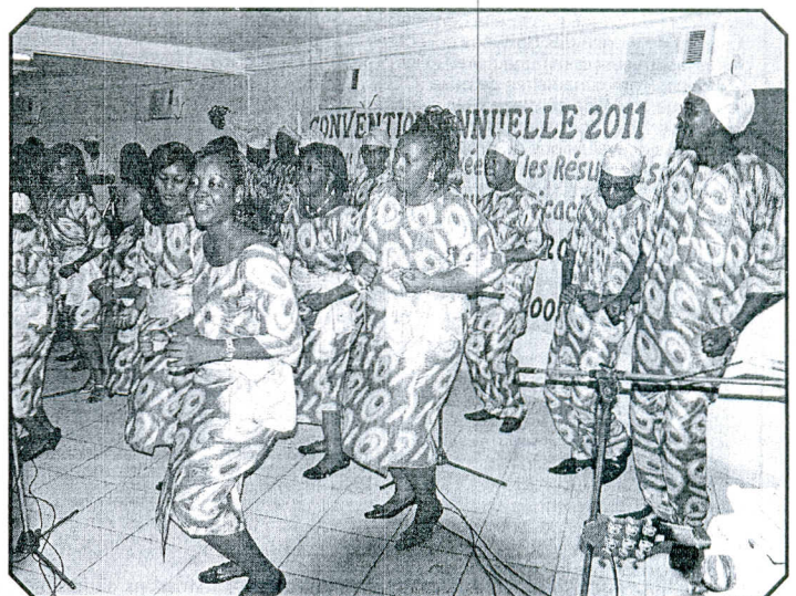
... les belles prestations de la chorale de l'Africaine des assurances fortement applaudie