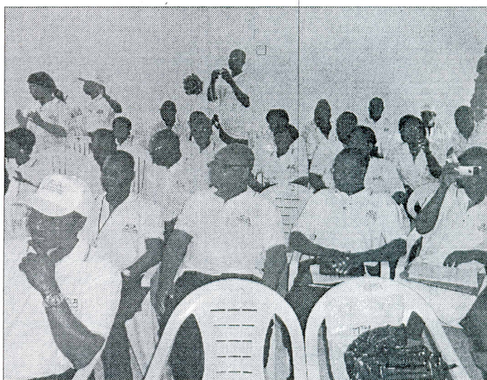
... en présence de la grande famille des travailleurs de l'Africaine des assurances.